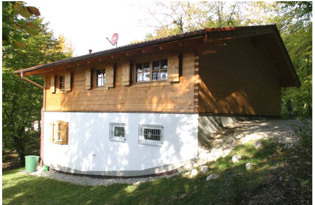
Variante mit Zugang vom Keller