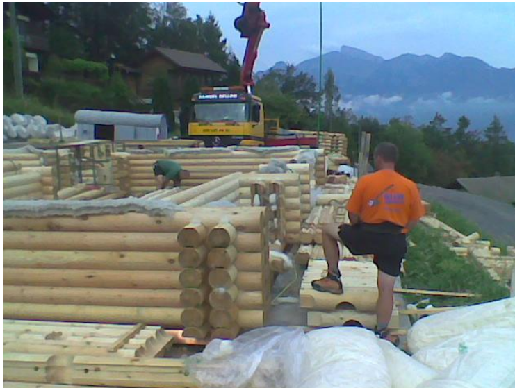
Bau des ersten MAHEDA-Duo-Round- Blockhauses in Torgon VS, Schweiz im Sommer 2009